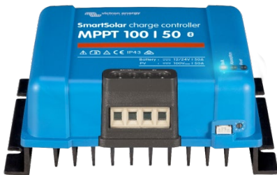
SmartSolar laddningsregulator MPPT 100/50