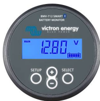
Bluetooth-avkänning BMV-712 Smart Battery Monitor