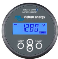
Bluetooth-avkänning BMV-712 Smart Battery Monitor