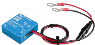
Bluetooth-avkänning Smart Battery Sense