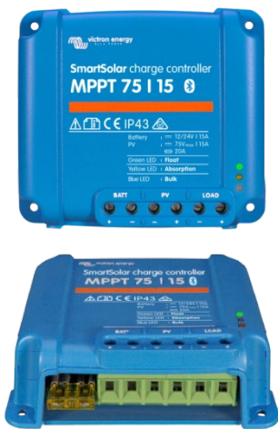
SmartSolar laddningsregulator MPPT 75/15