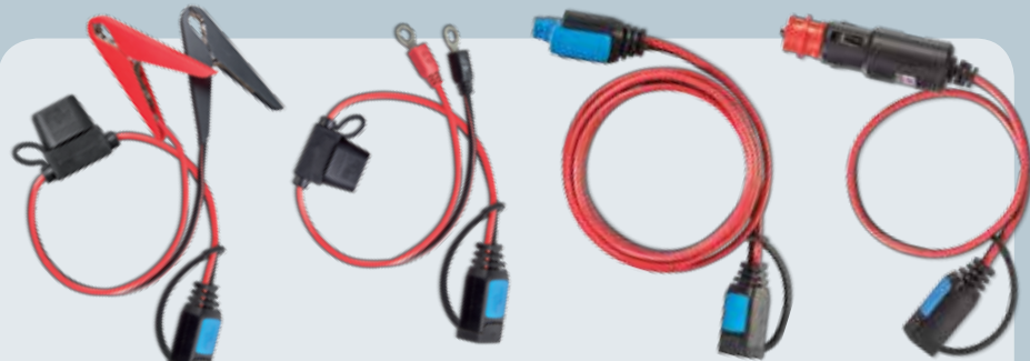
klämmor med säkring