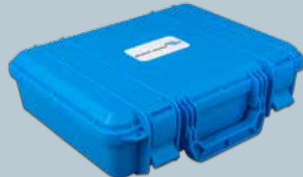
Bärfodral för laddaren och dess tillbehör